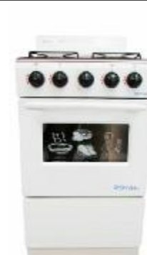
REF.: REH-4 FOGAO A GAS ROYAL