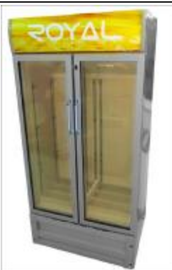
REF.: RFV-450G CONGELADOR 18' ROYAL