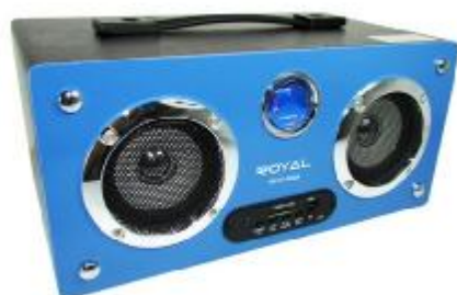
REF.: RPUS-600A RADIO FALANTE USB AZUL ROYAL