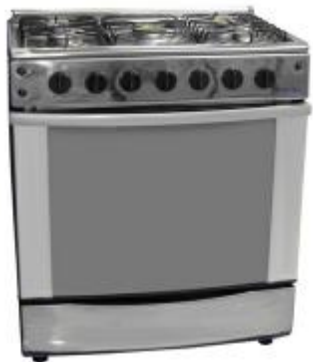
REF.: REH-90ST FOGAO A GAS ROYAL