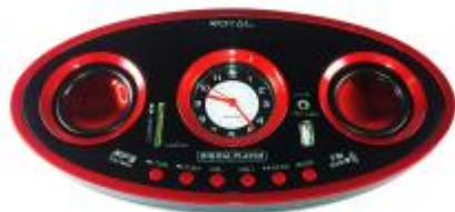
REF.: RPUS-306B RADIO FALANTE USB VERMELHO ROY