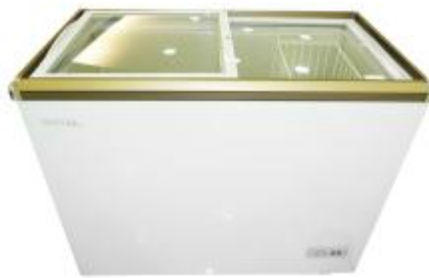
REF.: RFH-91G CONGELADOR 9.1' ROYAL