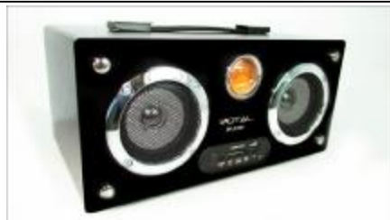
REF.: RPUS-600B RADIO FALANTE USB PRETO ROYAL