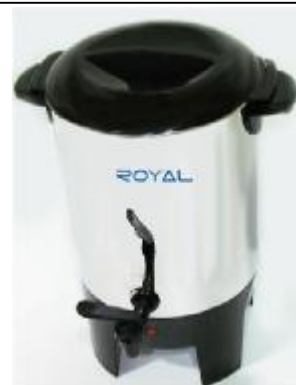
REF.: RC-1030 CAFETEIRA 30T ROYAL