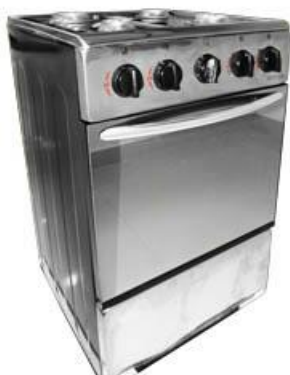
REF.: REH-4ST FOGAO A GAS DE ACERO 4Q ROYAL