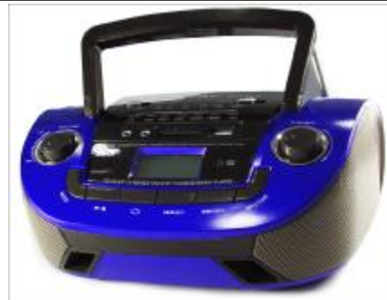
REF.: RPUS-631R RADIO SPEAKER USB ROYAL