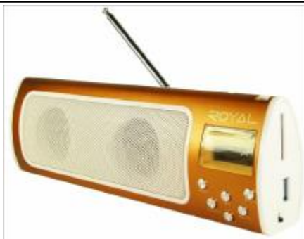
REF.: RPUS-81 RADIO FALANTE USB ROYAL