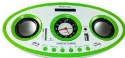
REF.: RPUS-306V RADIO FALANTE USB VERDE ROYAL