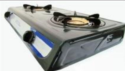
REF.: REG-211 FOGAO 2 QUEIMADORES A GAS ROYAL