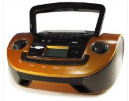
REF.: RPUS-631A RADIO SPEAKER USB ROYAL