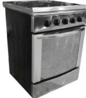
REF.: REH-60ST FOGAO A GAS ACERO 4Q ROYAL