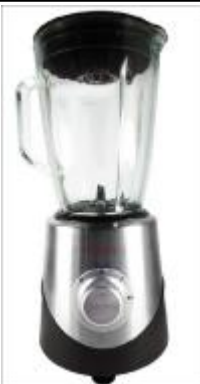
REF.: RL-200S LIQUIDIFICADOR 1.5V 2-1 ROYAL