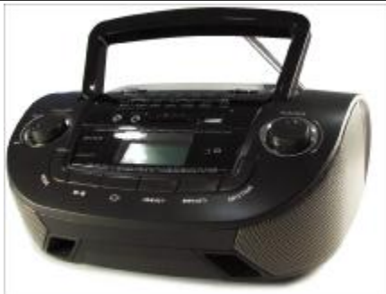
REF.: RPUS-631B RADIO SPEAKER USB ROYAL