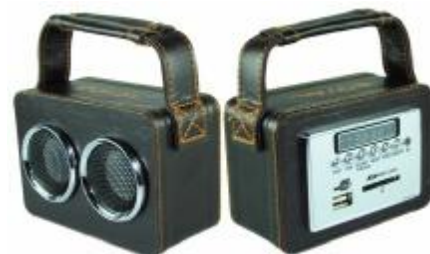
REF.: RPUS-4971 RADIO FALANTE USB ROYAL