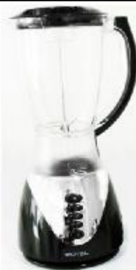
REF.: RL-468 LIQUIDIFICADOR 3V 350W ROYAL