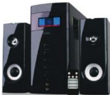
REF.: RS-255 RADIO USB ROYAL