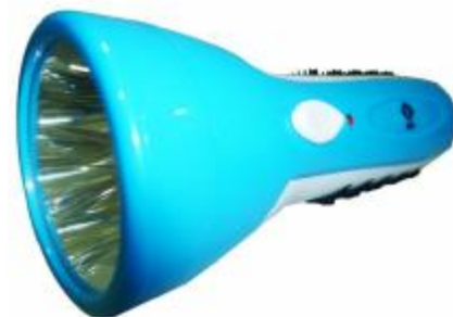
REF.: WL-3208 LANTERNA LED RECARREGAVEL WELL