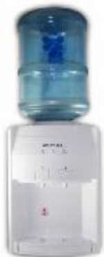
REF.: REM-132 GELADEIRA D/AGUA ROYAL