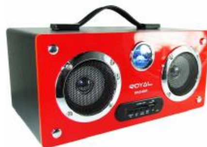
REF.: RPUS-600R RADIO FALANTE USB VERMELHO ROY