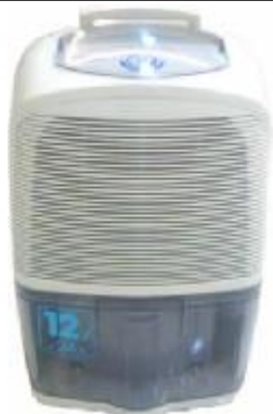
REF.: RDC-40 DESUMIFICADOR 12 LTR ROYAL