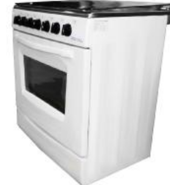
REF.: REH-80B FOGAO A GAS ROYAL