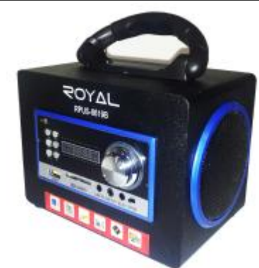
REF.: RPUS-8619B RADIO SPEAKER USB ROYAL