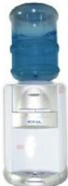
REF.: REM-264 GELADEIRA D/AGUA ROYAL