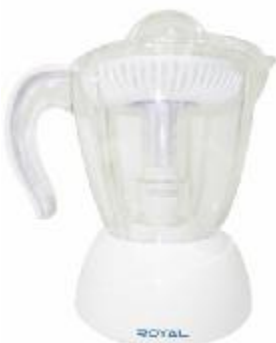
REF.: RE-2009 EXTRATOR DE SUCO ROYAL