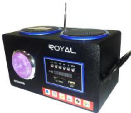
REF.: RPUS-8863B RADIO SPEAKER USB ROYAL