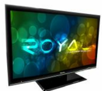
REF.: RLED-32 TV DE 32" LED ROYAL