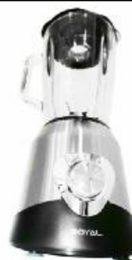
REF.: RL-7688 LIQUIDIFICADOR 1.5V 2-1 ROYAL