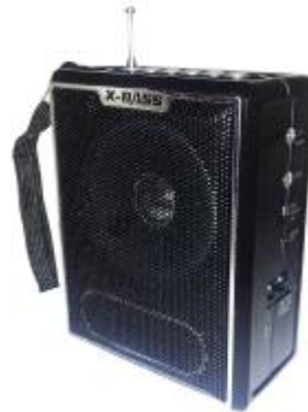
REF.: RPUS-047U RADIO SPEAKER USB ROYAL