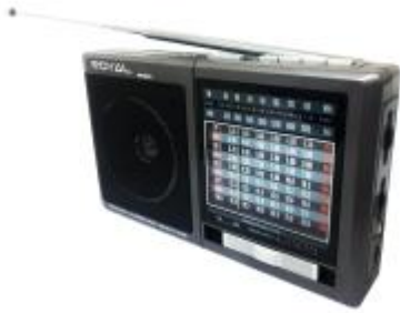
REF.: RPUS-027U RADIO SPEAKER USB ROYAL